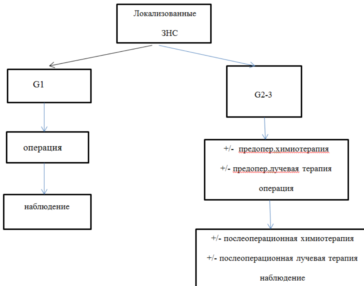
Рис. 1. Схема лечения пациентов с локализованными забрюшинными неорганными саркомами