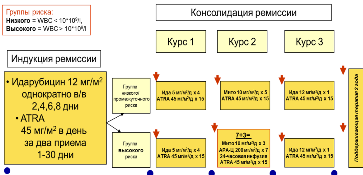
Схема лечения ОПЛ по программе AIDA/mAIDA [4,37,56]