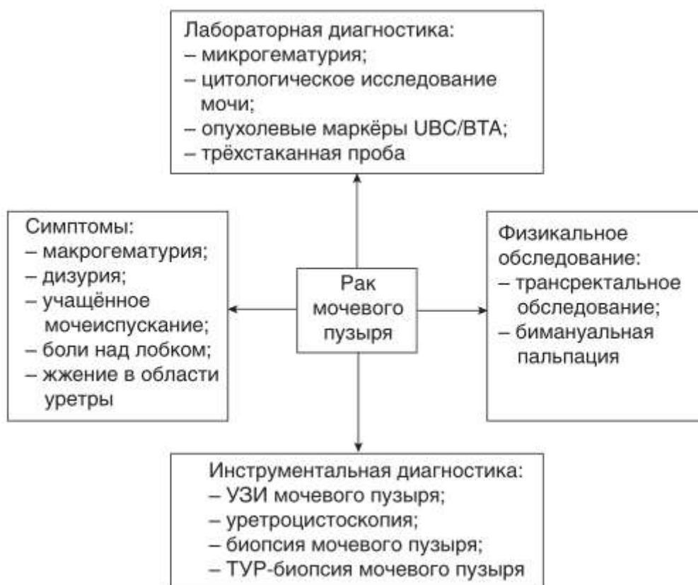
Рис. 2 Уточняющая диагностика рака мочевого пузыря